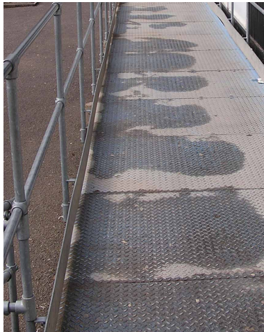
敷涂施工前的磨平钢材坡道